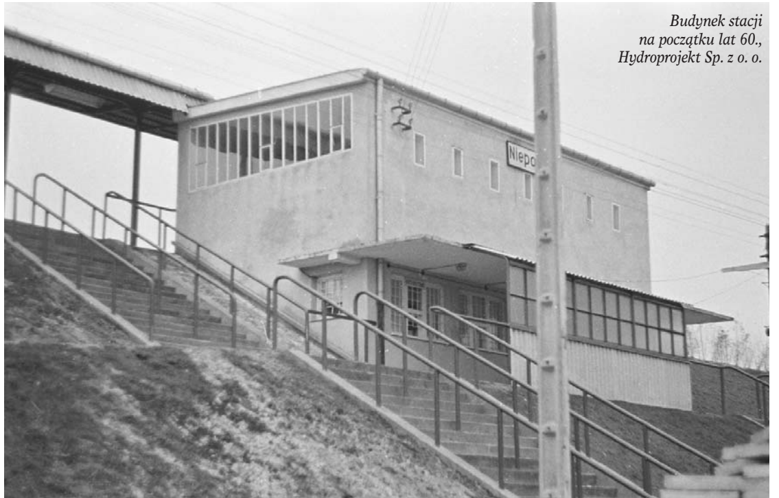
Budynek stacji na początku lat 60., Hydroprojekt Sp. z o. o.

Wróćmy jednak do Nieporętu. Jak wspominałem – tu przystanek nie powstał od razu. Pierwszy rozkładowy pociąg osobowy zatrzymał się w Nieporęciu i Dąbkowiznie 15 maja 1939 r. Dzielne kursowały 4 składy. Nieporęcki przystanek został uwieczniony na fotografii wykonanej w czasie wojny przez niemieckiego żołnierza. Na zdjęciu znajduje się wiele ciekawych szczegółów. Oprócz osób czekających na peronie z bankami na mleko, jadących praw-