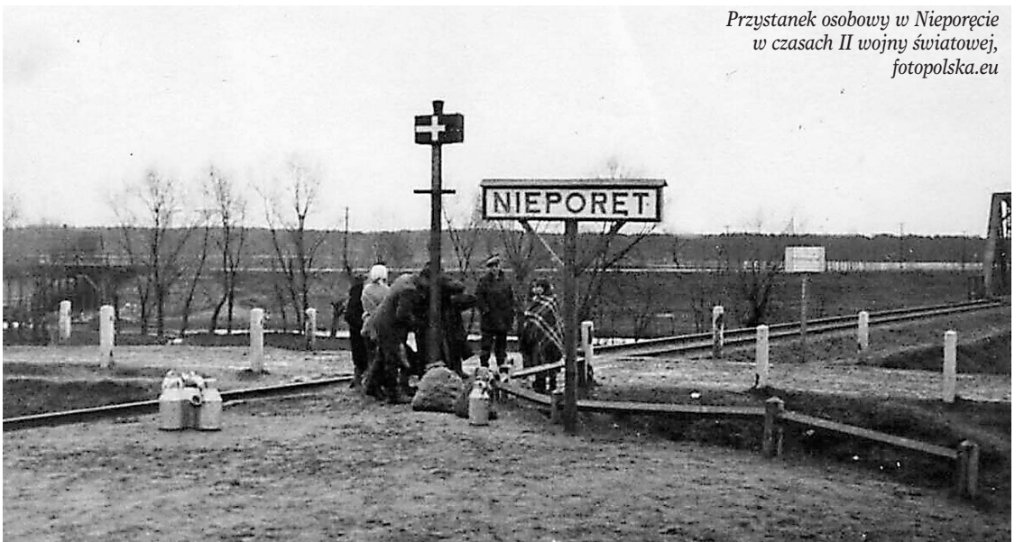
Przystanek osobowy w Nieporęciu w czasach II wojny światowej

dopodobnie na targ do Legionowa lub Radzymina, widoczny jest przejazd kolejowy na ul. Dworcowej oraz fragment stalowego mostu kolejowego na Kanale Królewskim. W oddali dostrzec można też most drogowy. Linia kolejowa została zniszczona podczas działań wojennych w 1944 r. Ponownie pociągi dojechały do Nieporętu w 1947 r. Było to sześć kursów dziennie. Kanał Królewski składy pokonywały po drewnianym moście. Ciekawostką jest fakt, że w 1952 r. na moście wybuchł pożar. Jego powodem było niedomknięcie popielnika w parowozie TKT 48-57. Winą obarczono maszynistę i pomocnika maszynisty tegoż parowozu z parowozowni w Tłuszczu. W związku z budową Kanału Żerańskiego i Jeziora Zegrzyńskiego tory poprowadzono po nasypie. Powstał nowy most i budynek stacji.